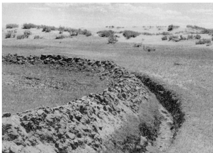
Рис. 4. Современные “ограждения” на пастбищных угодьях Внутренней Монголии (Williams 2002: 131, fig. 6.3).

(Белая книга 1992: 64, 80). На основании этого правительственного решения в течение очень короткого срока с Дальнего Востока было депортировано более 200 тыс. корейцев в Центральную и Среднюю Азию, в том числе около 40 тыс. в Казахстан. Переселение корейцев в Казахстан произошло в два этапа: первый начался с выселения из ДВК и закончился временным расселением в пунктах разгрузки; второй этап заключался в хозяйственно-территориальном перераспределении корейского населения внутри республики. Этот этап закончился к концу 1938 г. (Ким 1995).