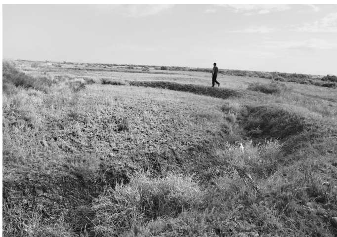
Рис. 3. Сооружение (“кора”) V.

мычку шириной 1,5 м. Перемычка закрывалась деревянной перегородкой. В том случае, когда одна сторона площадки была открыта (например, сооружение V), она перекрывалась деревянным забором или плетнем. Загоны строились, как правило, посреди рисовых полей. По словам информанта, загоны такого типа появились в регионе в 1950–1960 годах (возможно, несколько раньше) и предназначались для временной передержки скота (в основном крупнорогатого) – для того, чтобы животные не вытаптывали рисовые поля.